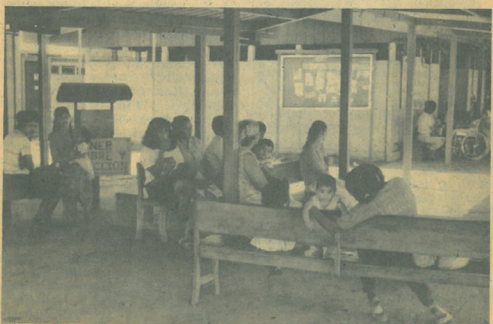
WARTERAM IM FREIEN. Bei nikaraguanischen Temperaturen sind die Bänke überdacht, um Patienten vor der Sonne zu schützen. Seit 1985 wird in diesen Containern operiert (Foto links).